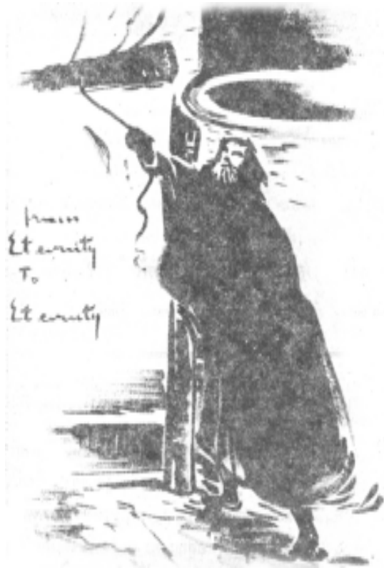
“จากอนันตะสู่อันตะ” โดย เอ็มมานูเอล เซอร์แมน