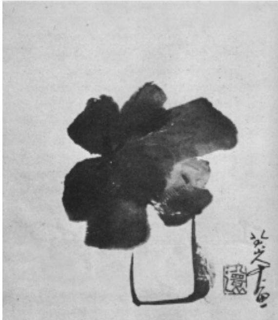
“ดอกไม้ในแจกัน” โดย ป้าต้าชานเยี่ยน